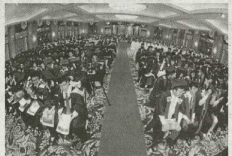
●投资者的热烈追捧, 促使精英国际集团荣登十大上升股宝座。